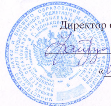
График приема документов, формирования приказов и перечисления стипендии и материальной поддержки на период с 1 сентября 2022 года по 31 августа 2023 г